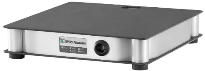
Vectron POS Modular mit Schlosssystem „Addimat“