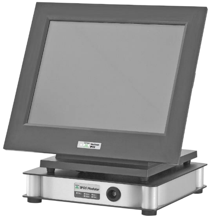
Vectron POS Modular mit Monitor Vectron D150T